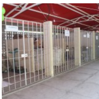
Baias de materiais recicláveis