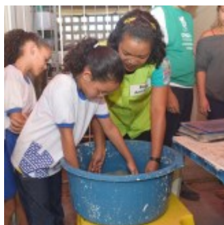
Oficina de papel