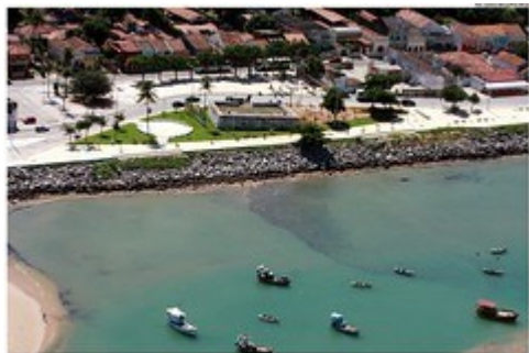
Vista aérea do Fortim do Queijo

Em função dos estudos sobre afundamentos iniciados na Avenida Ministro Marcos Freire, nas proximidades do Fortim do Queijo, a Secretaria de Transportes, Controle Urbano e Ambiental de Olinda irá alterar o trânsito do local por 30 dias a partir de amanhã (09/10). A circulação nas imediações da Praça do Carmo sofrerá modificações apenas no horário das 16h às 22h, que passará a ser: