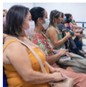
Gestores de Olinda se encontram para definir estratégias para a educação