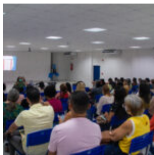
Gestores de Olinda se encontram para definir estratégias para a educação