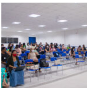
Gestores de Olinda se encontram para definir estratégias para a educação

A rede municipal de ensino de Olinda conta com 72 unidades, onde estão matriculadas cerca de 26 mil crianças e adolescentes.