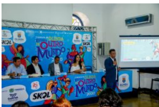
Coletiva Carnaval de Olinda 2020