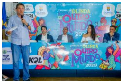
Coletiva Carnaval de Olinda 2020