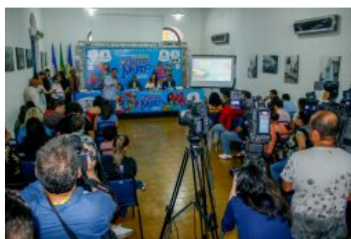
Coletiva Carnaval de Olinda 2020