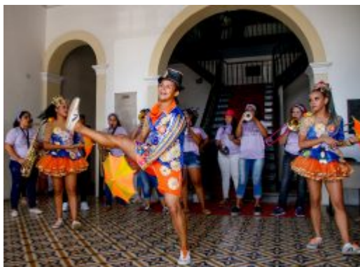
Coletiva Carnaval de Olinda 2020