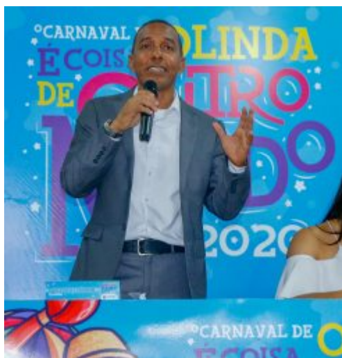
Coletiva Carnaval de Olinda 2020