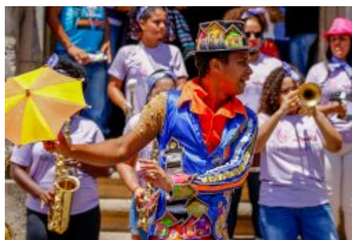
Coletiva Carnaval de Olinda 2020