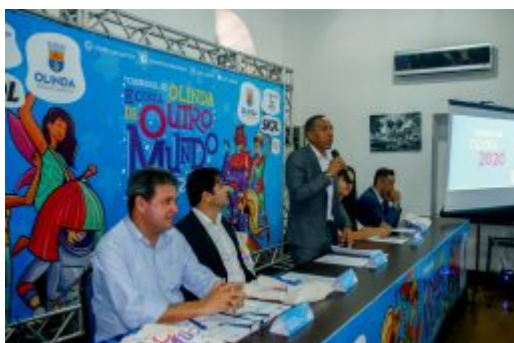
Coletiva Carnaval de Olinda 2020