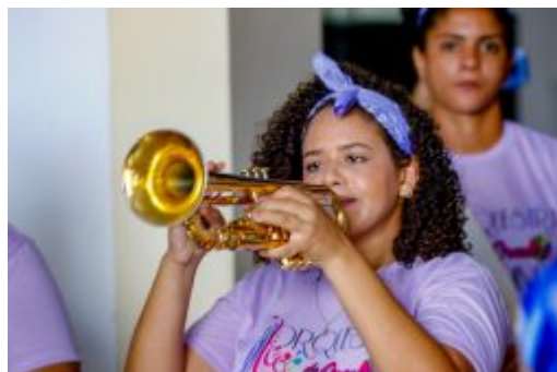
Coletiva Carnaval de Olinda 2020 - Fotos: marconi Meireles e Sandy James/divulgação PMO