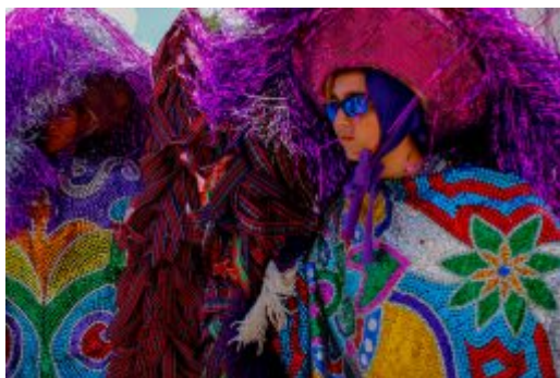
Coletiva Carnaval de Olinda 2020