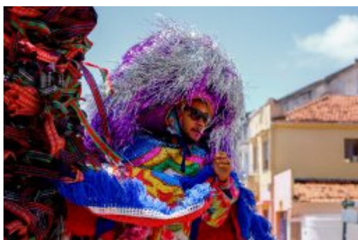
Coletiva Carnaval de Olinda 2020