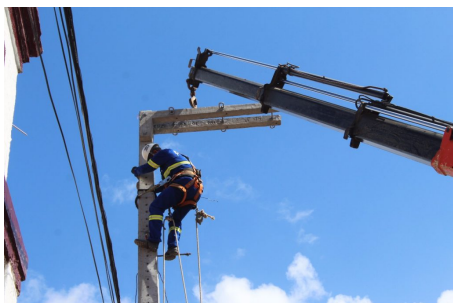
Intervenção na Rua do Bonfim.