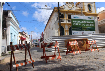
Intervenção na Rua do Bonfim.