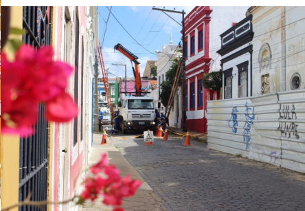
Intervenção na Rua do Bonfim.