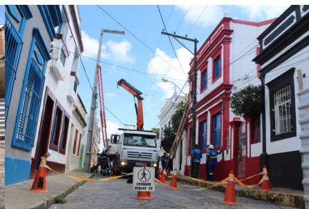
Intervenção na Rua do Bonfim.