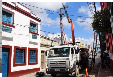
Intervenção na Rua do Bonfim.