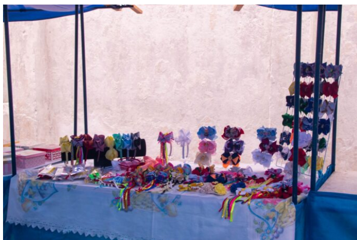
Feira do Empreendedor