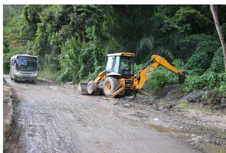
Foto Atual Estrada