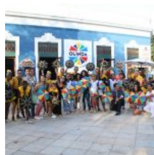
Praça Maxambomba recebe público para comemoração ao Dia do Frevo