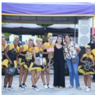
Praça Maxambomba recebe público para comemoração ao Dia do Frevo