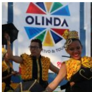
Praça Maxambomba recebe público para comemoração ao Dia do Frevo