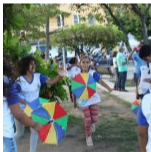
Praça Maxambomba recebe público para comemoração ao Dia do Frevo