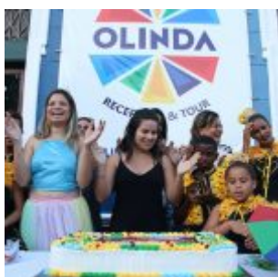
Praça Maxambomba recebe público para comemoração ao Dia do Frevo