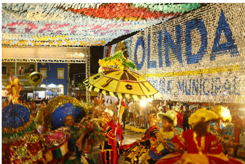
Carnaval 2020, Polo Mestre Afonso - Foto: Sandro Barros / PMO

Podem participar pessoas físicas, maiores de 18 anos, ou pessoas jurídicas, que desenvolvam atividades, ações e projetos relacionados à tradições e saberes da cultura popular ou tradicional, domiciliadas e com atuação comprovada no Município de Olinda, há no mínimo 10 (dez) anos. Acesse aqui o Edital Memória Viva.